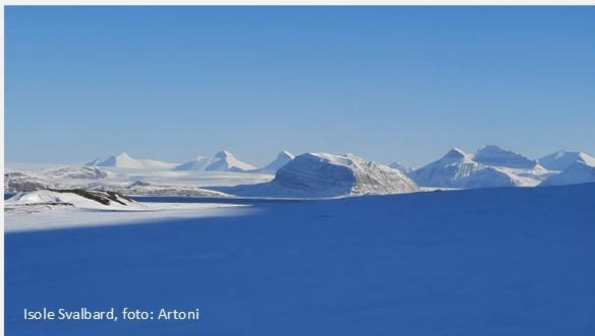
Isole Svalbard, foto: Artoni

Martedì, 10.2.2026, ore 21.00, sala Ortles