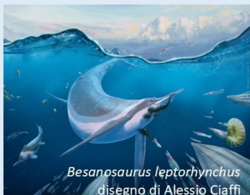
Besanosaurus leptorhynchus disegno di Alessio Ciaffi

Ricostruzione artistica di un Besanosauo a caccia di Phragmoteuthis , parenti dei calamari. A sinistra nuotano due piccoli ittiosauri del genere Mixosaurus e un gruppo di ammonoidi del genere Ceratites . A destra si nota un ammonoide del genere Serpianites .